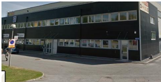
Verkstad / Utställning på G. Flygplatsvägen 4 i Torslanda

På Husknuten AB i Västra Frölunda kan Du träffa våra representanter under sommaren för visning och demonstration av Robomows gräsklipparrobotar från maj 2019. Du kan även besöka vår robotverkstad och utställning på Gamla Flygplatsvägen 4 i Torslanda och få rådgivning av vår professionella personal vilken maskin som passar just Din trädgård. Vi erbjuder även tomt-besiktning inom Göteborg och Kungsbacka. Vill du träffa oss för demonstration kan du boka en tid med oss. Boka på telefon 031-384 04 90 eller 0300-688 490.