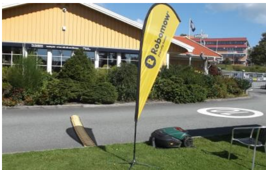
Demoarena på Husknuten i Västra Frölunda